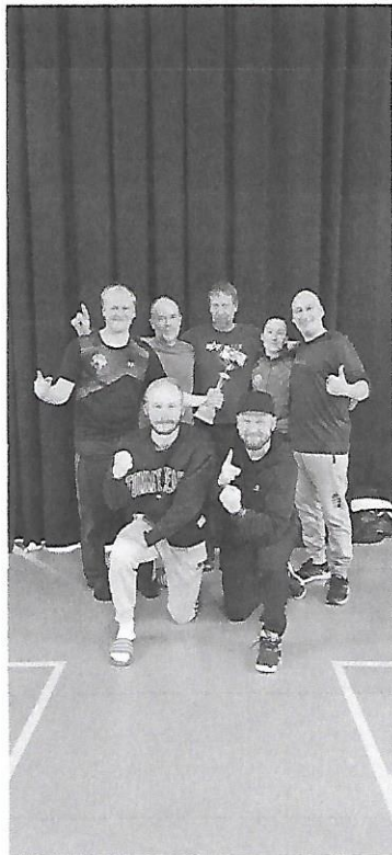
Voittanut joukkue ja pokaali!